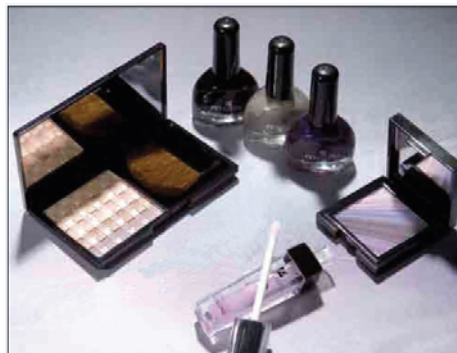
IMAGEN PREMIO Y CUPON DE CAMPAÑA

Estas bases se encuentran publicadas en servicio al cliente de cada tienda que participa en la campaña y en www.lapolar.cl .