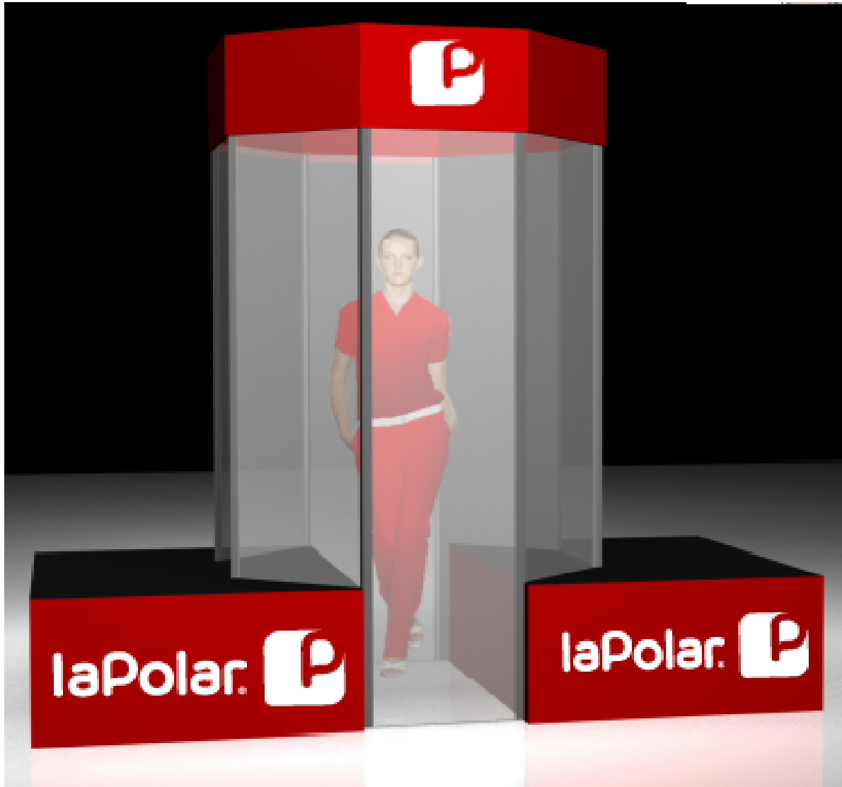
IMAGEN CICLON MILLONARIO