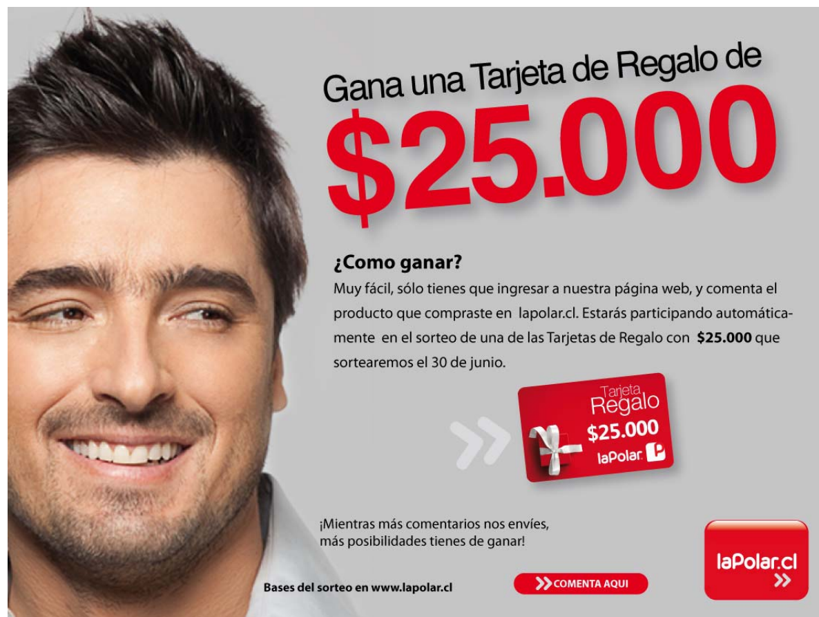
IMAGEN DE PUBLICIDAD

Estas bases se encuentran publicadas en www.lapolar.cl .